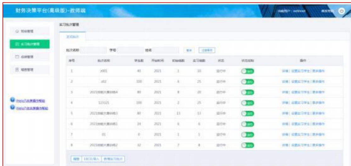
图3 网中网财务决策平台