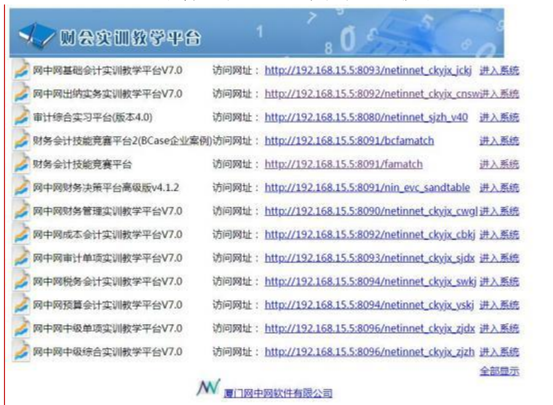
图1 网中网财会实训教学平台