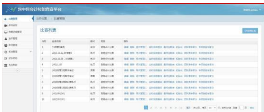
图2 网中网会计技能竞赛平台